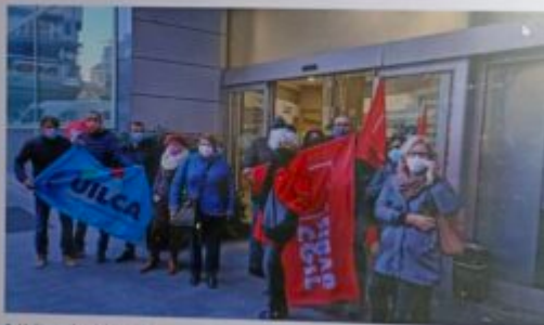
• Un'immagine del presidio