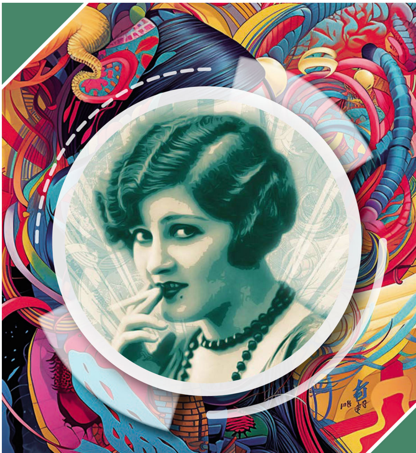
IL TALENTO RUBATO ALLE DONNE Zelda Fitzgerald (USA 1900-1948)

Zelda fu una delle prime flapper degli anni '20 degli Stati Uniti, ovvero donne che reclamavano un nuovo stile di vita ed