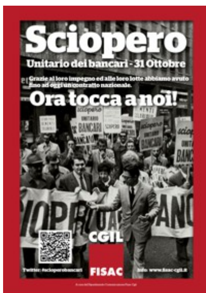
1 - Clicca qui per scaricare la Locandina: Ora tocca a noi!