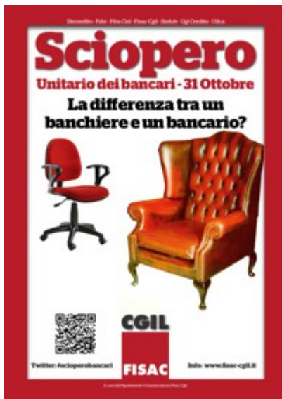
7 - Clicca qui per scaricare la Locandina: Bancari e Banchieri