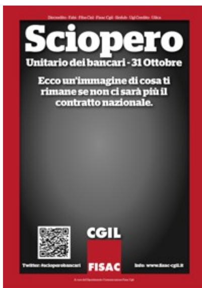
3 - Clicca qui per scaricare la Locandina: Senza Contratto Nazionale!