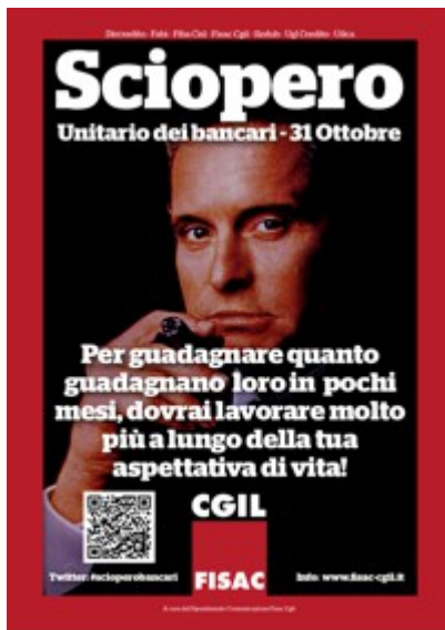
2 - Clicca qui per scaricare la Locandina: Compensi e Top Managers